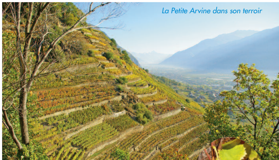
La Petite Arvine dans son terroir