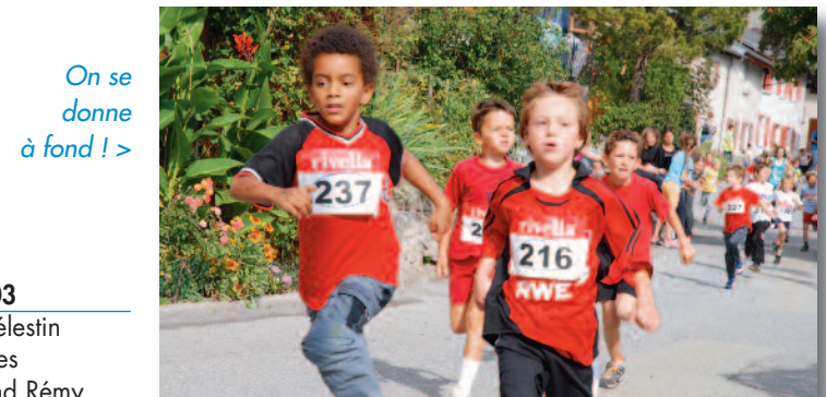
On se donne à fond ! >