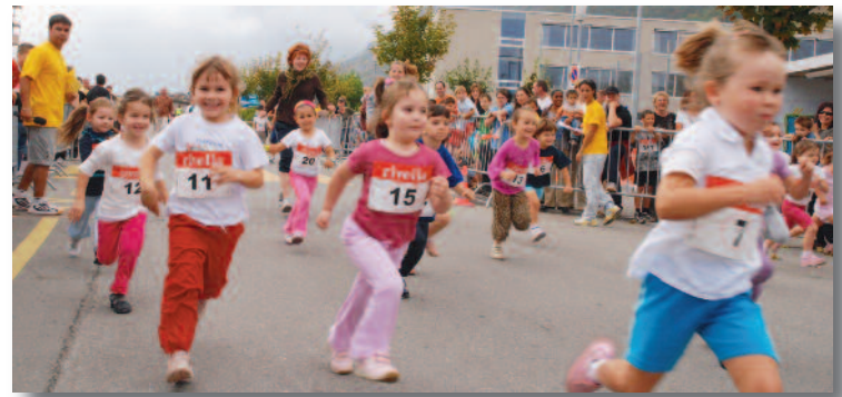
Les poussines toutes radieuses