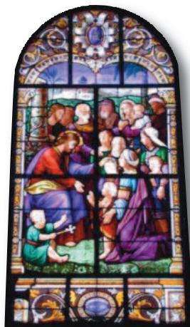
«Laissez venir à moi les petits enfants»

Quatre thèmes liés aux temps liturgiques sont proposés dans l'année. Une célébration familiale est organisée, à l'église, où sont invités les enfants et leur famille. Elle permet aux enfants de se familiariser avec l'église (le bâtiment) et leur apprend à écouter la Parole de Dieu, ainsi