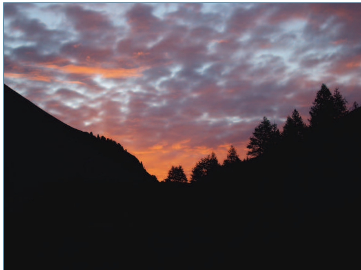
Le soleil se lève sur les hauts de Fully