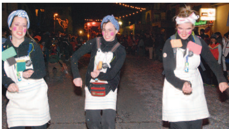
Les «putzfrau» de Fully