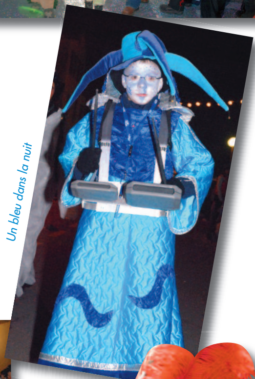
Un bleu dans la nuit