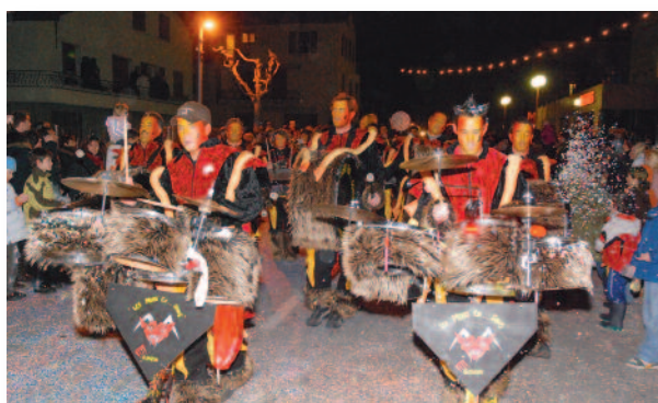
Les traditionnelles guggens