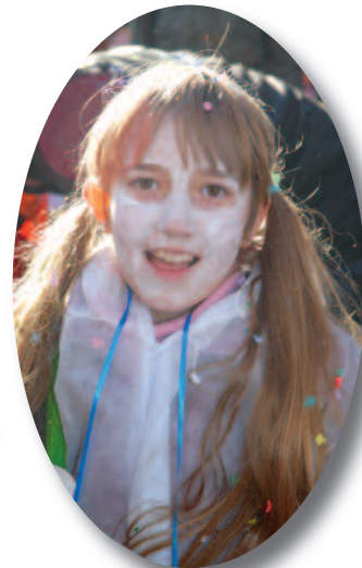
Serait-ce Blanche ?