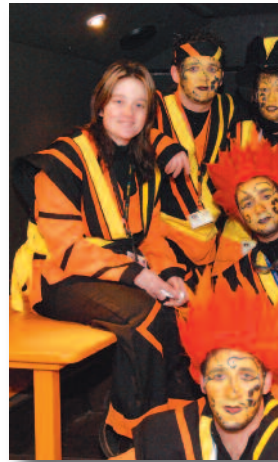
Le comité C