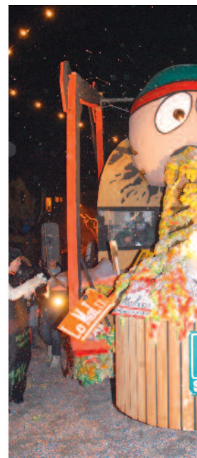
Les molks sont de la