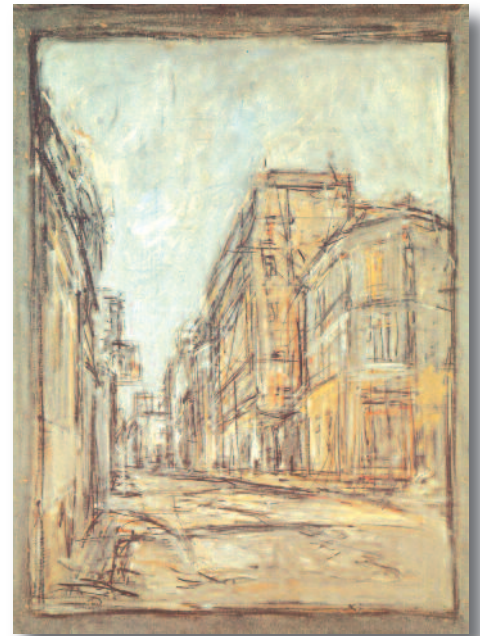
LA RUE Alberto Giacometti 1952 - Huile sur toile, 73 x 54 cm Collection Beyeler, Bâle

Des compétences particulières permettent de qualifier une performance. Ayant fait de l'aquarelle, il sera aisé de reconnaître la prouesse d'une œuvre. De même, une ignorance du