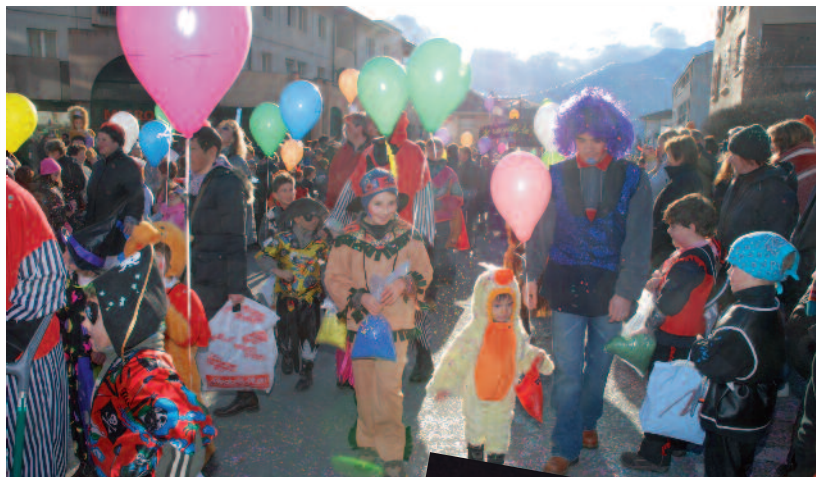
Le cortège des enfants