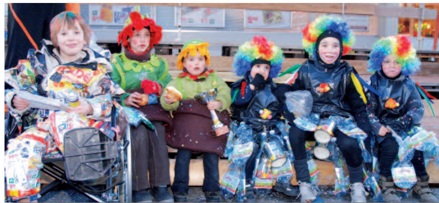
Les gagnants du meilleur déguisement