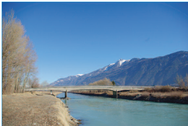
Harmonie... Mariage de l'ancien et du nouveau !