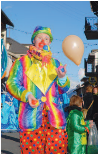
Haut en couleur