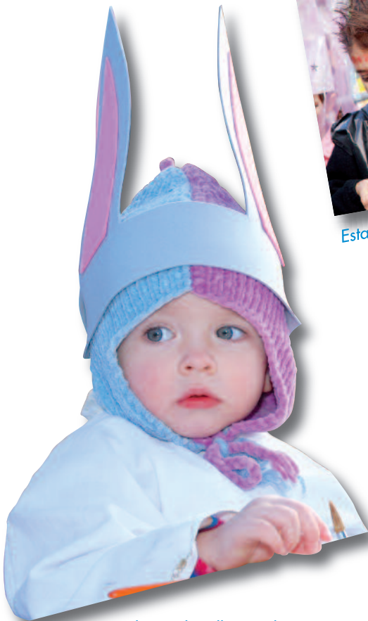
Une bonne bouille sans le savoir