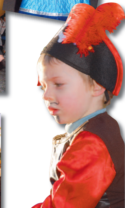
Un pirate en herbe