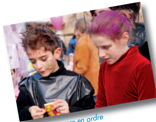
Estampillé propre en ordre