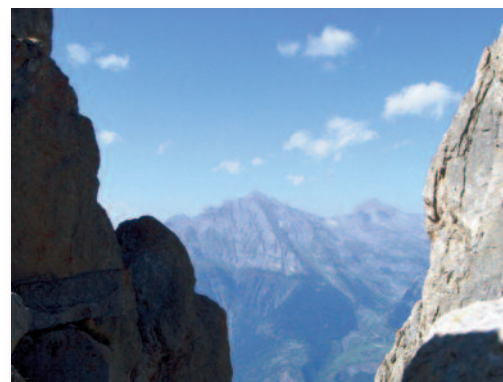
Un petit coin de ciel

L'ascèse et le dépouillement apparaissent donc comme un chemin de liberté et de croissance, pour une pleine jouissance de la vie et l'épanouissement des forces créatrices propres à chacun. Quelles que soient les circonstances, elles n'empêchent pas de trouver la vie belle et riche de sens. Avec une grande paix intérieure et une confiance inébranlable : « On ne peut rien nous faire, vraiment rien. » Ce qui importe, c'est « de rester fidèle à soi-même,