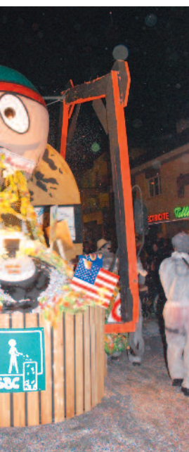
la fête, char fulliérain