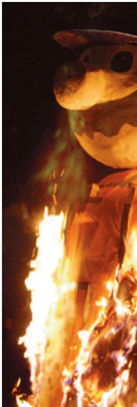
La «poutraze» a