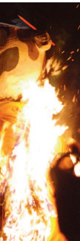
le feu au corps