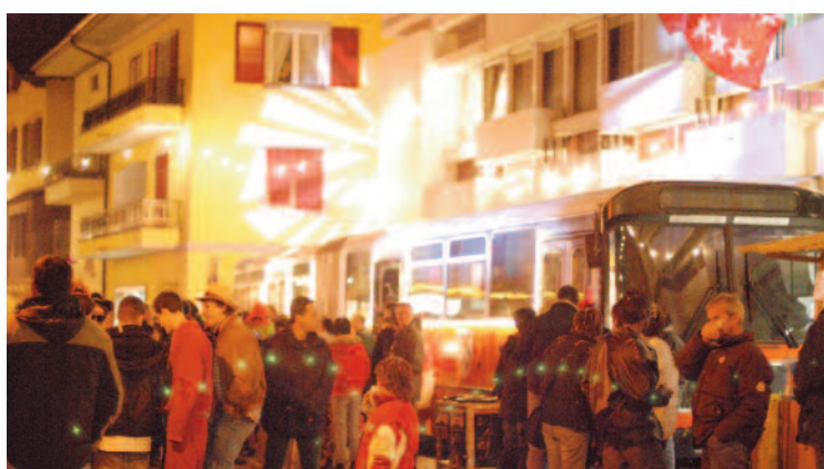
Bain de foule du nouveau bus du CarnaFully