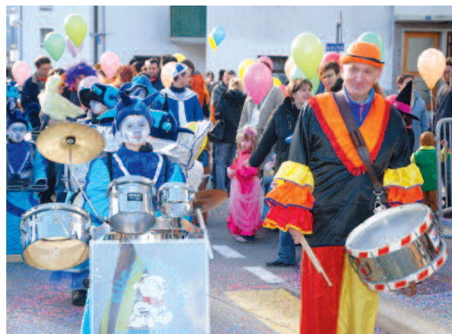
Prêt pour la relève