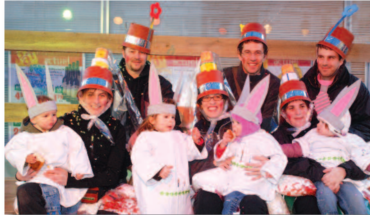
Les gagnants du meilleur char