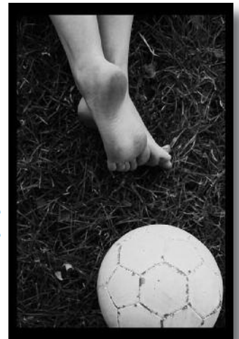
La Ligne blanche