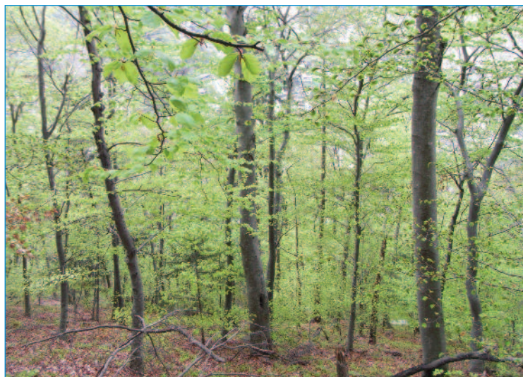
«Réveil dans les sous-bois»