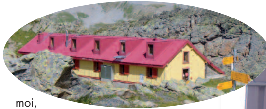
Tour des Muverans 2007

Voilà ! notre périple s'arrête là, devant une bonne crêpe à la confiture. J'ai les doigts tout collants, mes cheveux dégoulinent, mais je suis très contente. Mes parents ont cru en