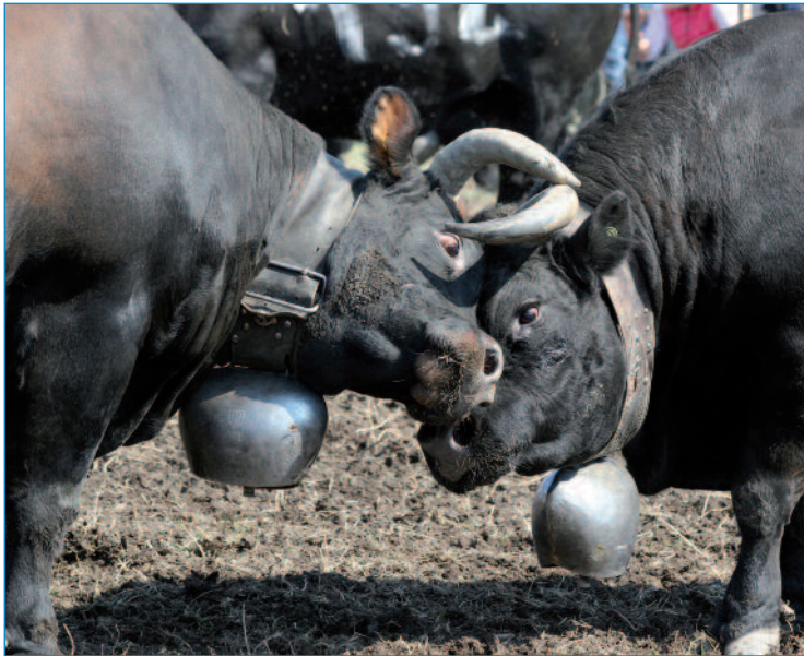
Combat de Reines