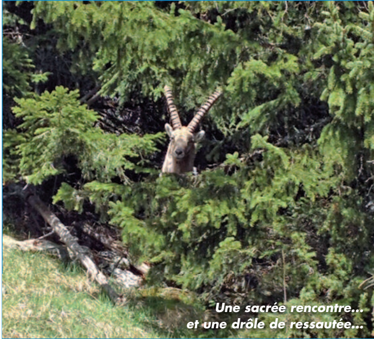
Une sacrée rencontre... et une drôle de ressautée...