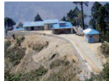
Hôpital de Lukla avant le séisme.

Liens à suivre : www.hopital-lukla.ch www.mdm.ch/magasins/fully