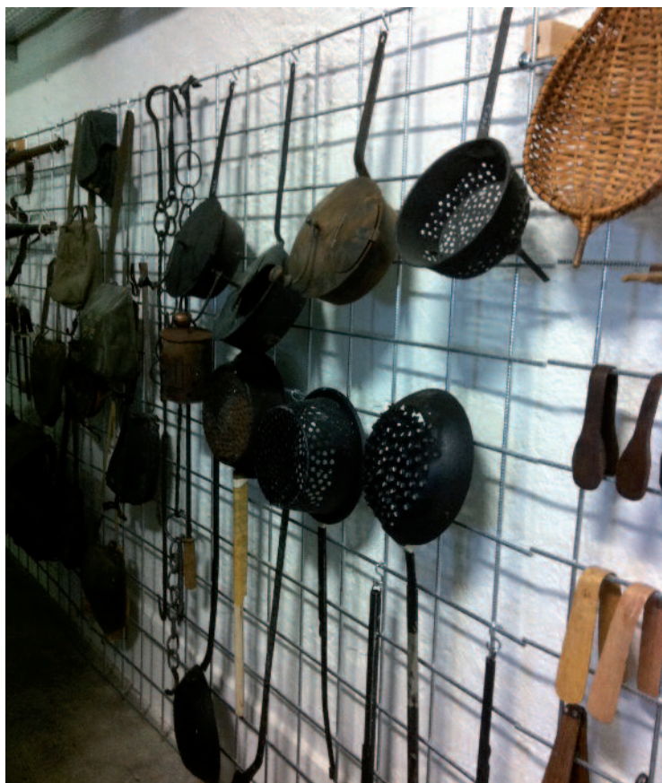
L'art de la brisolée sera au cœur de l'exposition durant la Fête de la Châtaigne.

Dès le 19 octobre, sur demande à l'Office du tourisme de Fully, ot@fully.ch ou 027 746 20 80 (12 pers max, forfait de Fr. 50.- par visite).