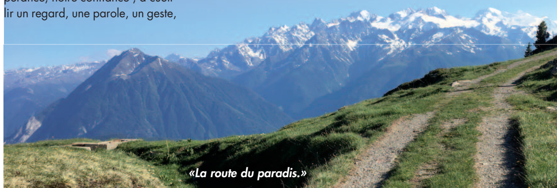
«La route du paradis.»