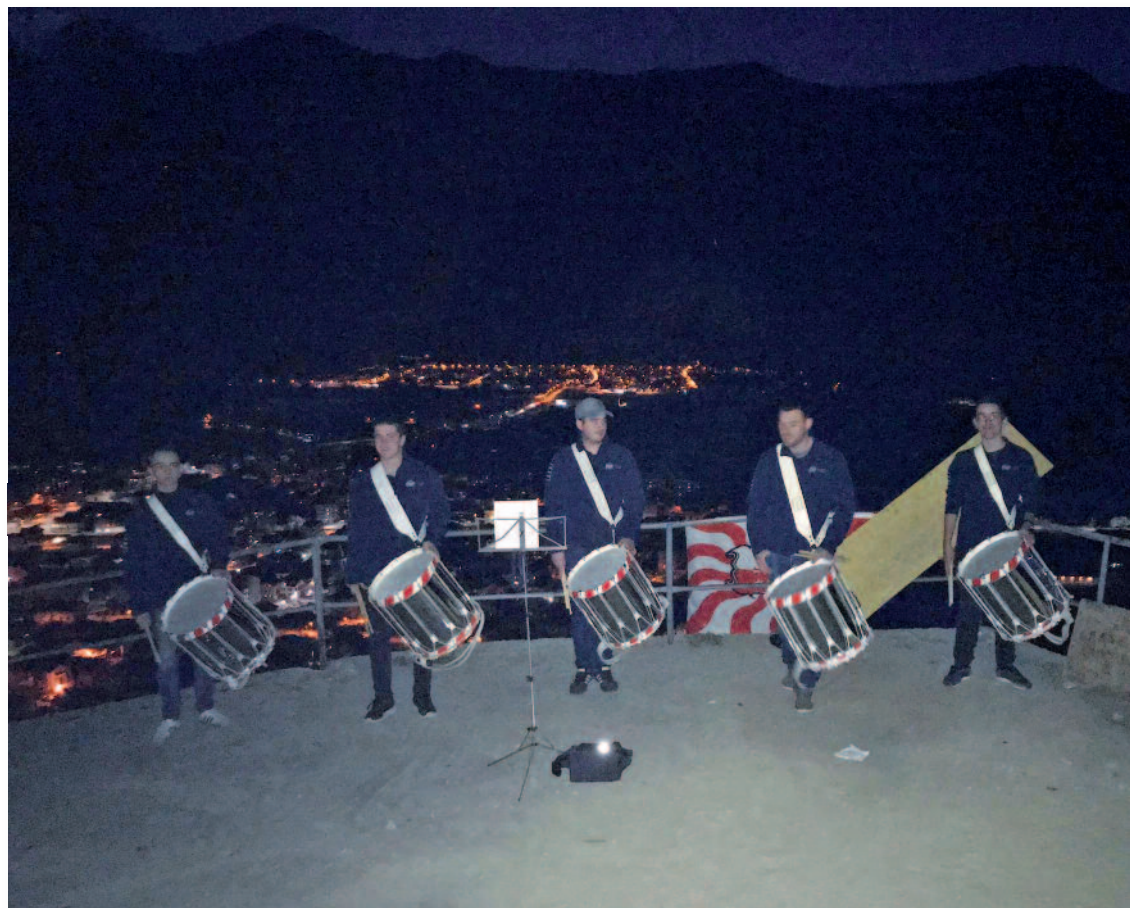
Prestation de la SympaClique, réunissant les tambours des fanfares La Liberté-Concordia de Fully-Saxon et l'Avenir de Fully.