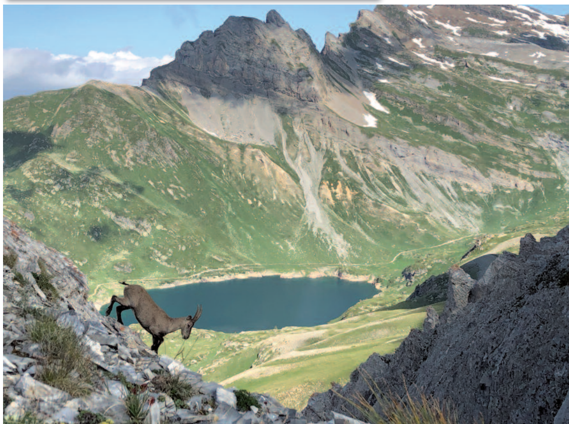
Patience et appareil photo: le bouquetin est capturé!