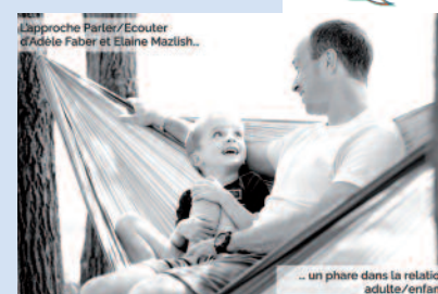
... un phare dans la relation adulte/enfant.