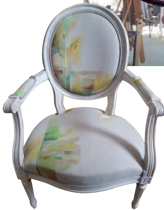
Une chaise peinte