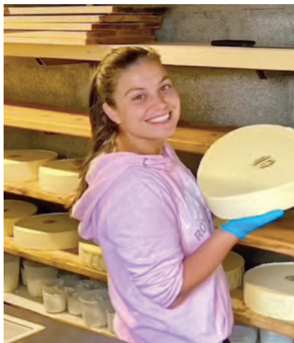
Les meules, nos trésors. Roțile de brânză, comorile noastre.