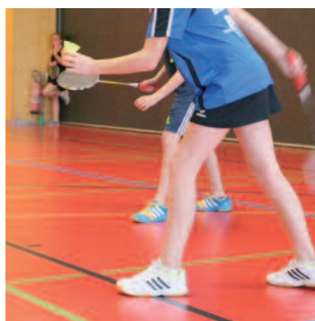
◀ En plein match.