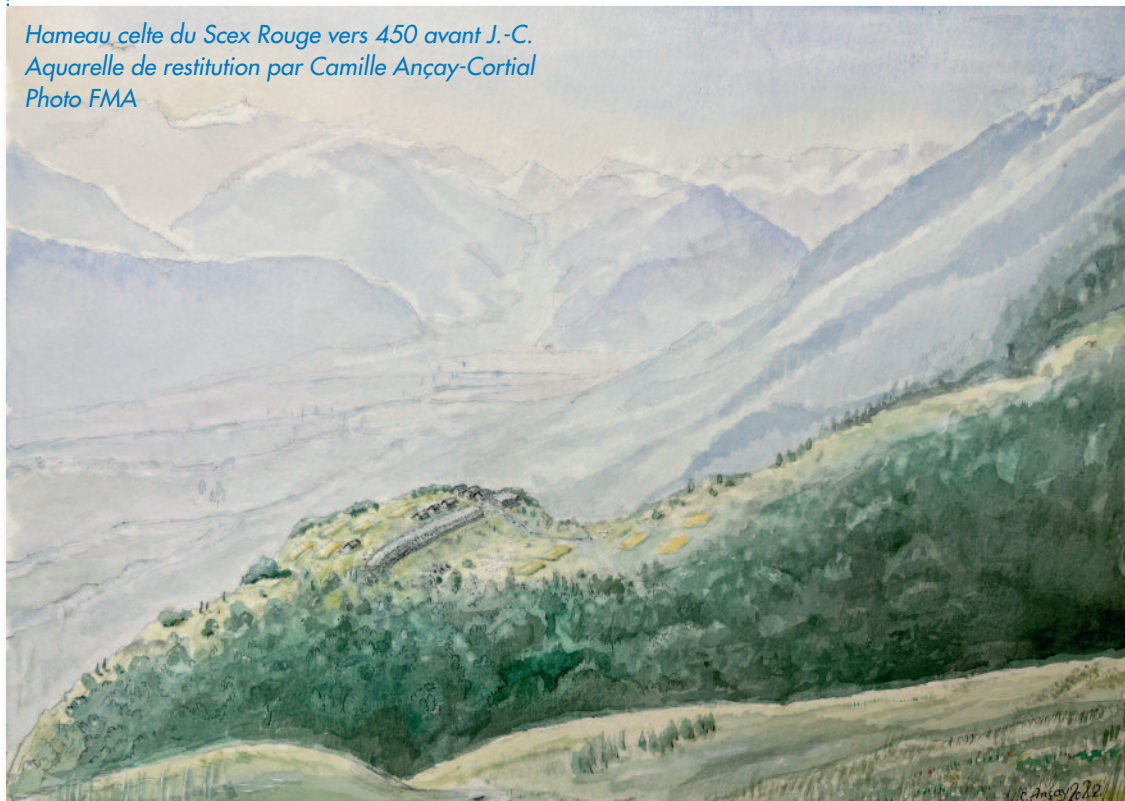
Hameau celte du Scex Rouge vers 450 avant J.-C. Aquarelle de restitution par Camille Ançay-Cortial

Grâce à nos donateurs nous préservons votre histoire! Si vous aussi, souhaitez nous soutenir, voici pour vous faciliter la tâche, un QR TWINT